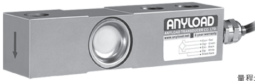
量程: 500kg-20t / 1Klb-20Klb